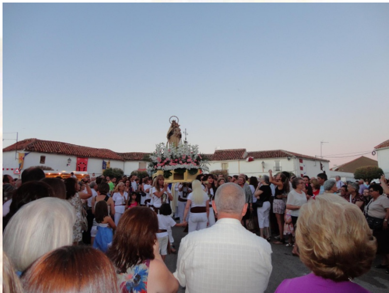
Procesión de Nuestra Señora del Carmen en el año 2012, en la celebración del VIII Centenario de la Batalla de las Navas de Tolosa. Casas de colonos al fondo.