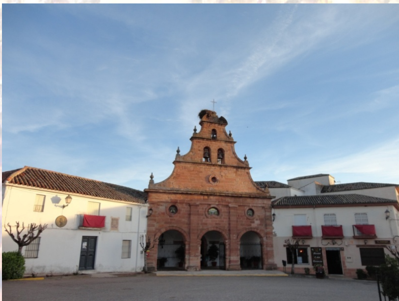
Conjunto monumental: Casa el Párroco, Iglesia de la Inmaculada Concepción y casa del Comandante Civil.

Pocas poblaciones tienen la oportunidad de celebrar dos efemérides tan importantes con tan pocos años de diferencia, y Navas de Tolosa es una de ellas. Si en el año 2012, celebramos el VIII Centenario de la Batalla de las Navas de Tolosa, una fecha cargada de simbolismo para nuestra población y sus habitantes, como orgullosos herederos de la Batalla, ahora vamos a festejar la firma de la carta magna que propició el nacimiento y formación de las Nuevas Poblaciones, la quinta provincia de Andalucía en el siglo XVIII, junto con los reinos de Córdoba, Jaén, Granada y Sevilla. Navas de Tolosa fue una de las capitales de feigresía, con sus aldeas del Rey o de Fuente del Rey (Ocho Casas) y del Camino de Vilches (Seis Casas).